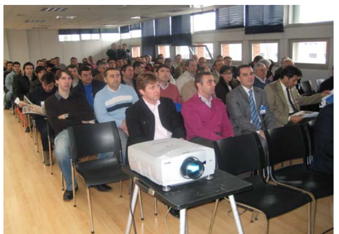
Muestra de la gran afluencia de público